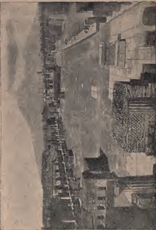
Foro o Foro Civile (Pompei).